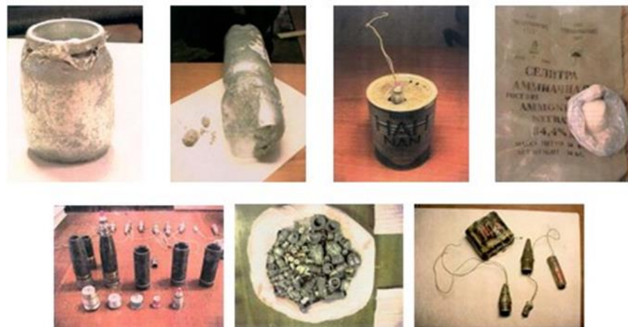
Фотографии взрывных устройств и их компонентов, изготовленных из штатных боеприпасов, аммиачной селитры и алюминиевой пудры, изъятых в процессе оперативно-розыскных мероприятий оперработниками ФСБ России

ПОМНИТЕ: внешний вид предмета может скрывать его настоящее назначение. В качестве камуфляжа для взрывных устройств используются обычные бытовые предметы: сумки, пакеты, свертки, коробки, игрушки и т.п.